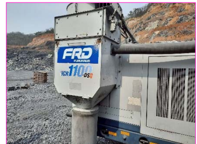
การปิดคลุมเครื่องเจาะระเบิด