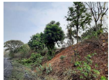
แนวต้นไม้ภายในโครงการ