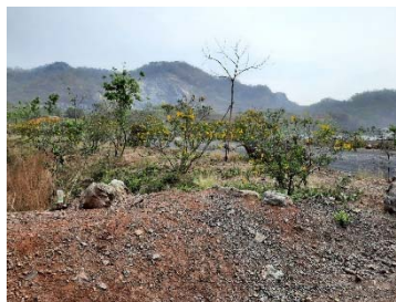
ต้นไม้บนคันทำนบกั้นดิน