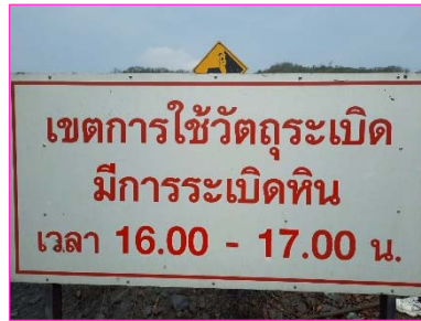
ป้ายเตือนเขตการใช้วัตถุระเบิด