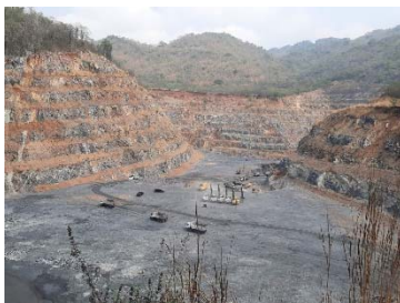
หน้าเหมืองของโครงการ