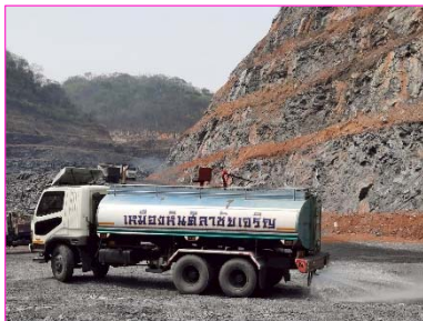
รถบรรทุกฉีดพรมน้ำ