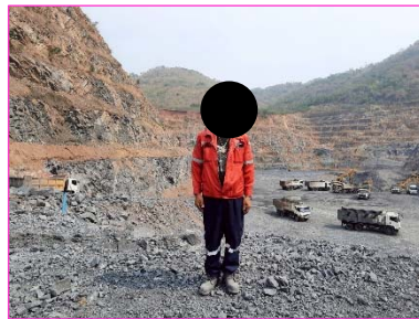
พนักงานสวมใส่อุปกรณ์ป้องกันอันตราย