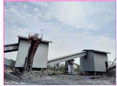
การปิดคลุมโรงโม่หินของโครงการ