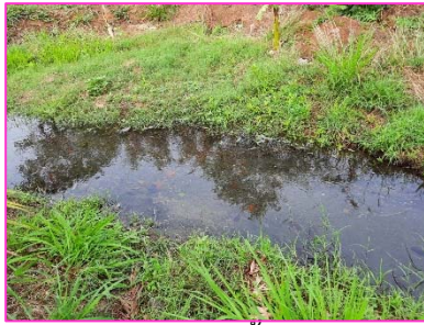
คูระบายน้ำ