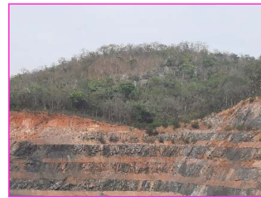
พื้นที่ที่ไม่มีการทำเหมือง