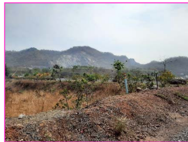
แนวคันทำนบดิน